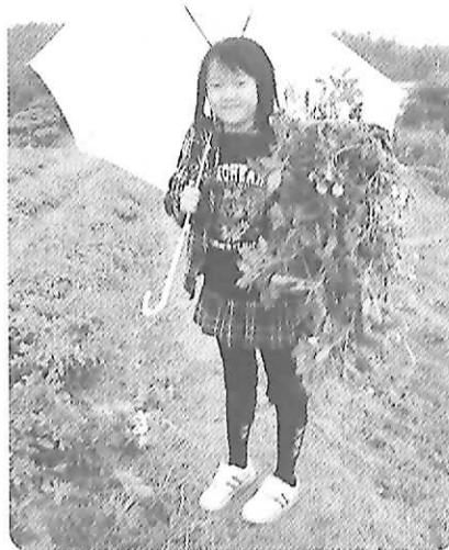
▲落花生の収穫体験