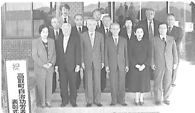
高取町自治功労者表彰式

11月12日、平成20年度高取町自治功労者表彰式が行われ、町の発展に尽くされた10名の方々が受賞されました。 これは、高取町表彰条例に基づき、町自治振興に寄与された方に贈られるもので、次の方々が表彰されました。