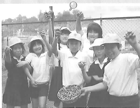
▶ 黒豆収穫体験 (5年生)

今後もさまざまな農業体験が計画されています。この取り組みが自然の素晴らしさを感じてもらえるきっかけになればいいですね。