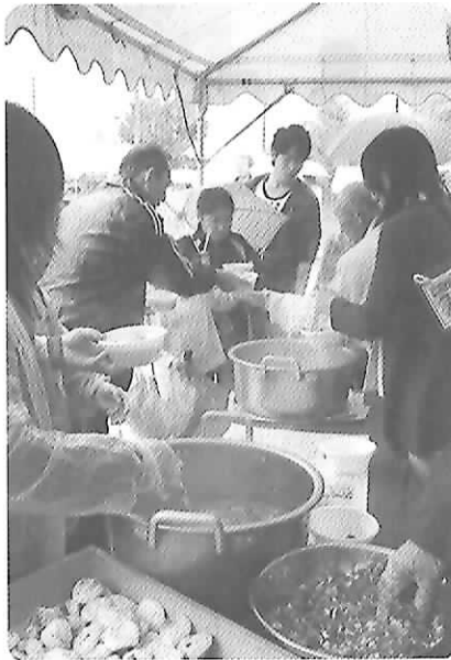
▲熱々の「ごんだ鍋」の振る舞い

11月16日、高取町児童公園と周辺圃場で高取町農業祭(ごんだ祭り&もりだくさん収穫体験)が行われました。この日は、サツマイモ・ジャガイモ・落花生・大根などを収穫体験できるとあって、多くの家族連れが訪れました。袋いっぱい詰めた野菜を持ち帰る姿が見られ、「楽しかった」と満面の笑みが印象的なイベントとなりました。自分で収穫した野菜や果物を食べることの喜び、これは何事にも変え難い喜びですね。