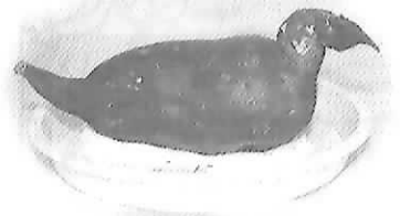
▲おもしろ野菜審査員特別賞 ハトの形をしたサツマイモ