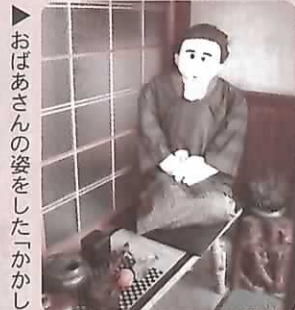
▶ おばあさんの姿をした「かかし」

そこで、かかし作りに協力 していただける方を大募集。 12月中旬に「かかし作り教 室」を開催しますので、参加 を希望される方は役場企画財 政課までお申し込みください。