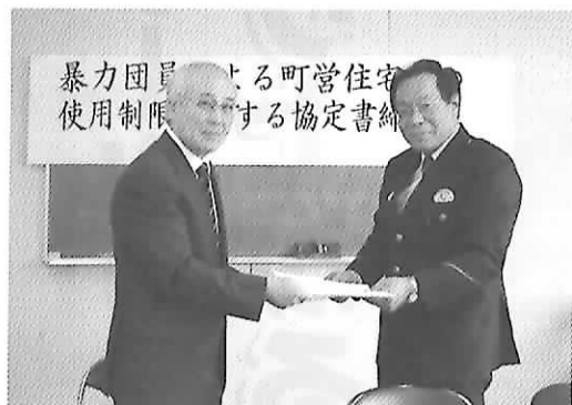
暴力団員による町営住宅使用制限に関する協定書締結

東京都町田市の都営住宅において発生した暴力団員による立ちこもり発砲事件を契機として、公営住宅における暴力団排除の要請が全国的に高まっています。高取町においても本年6月議会で高取町営住宅管理条例の一部改正を行い、この度榎原警察署との協力体制を強化するため、「暴力団員による町営住宅等の使用制限に関する協定書」を平成21年10月8日に締結し、暴力団員の町営住宅への入居を制限することとなりました。