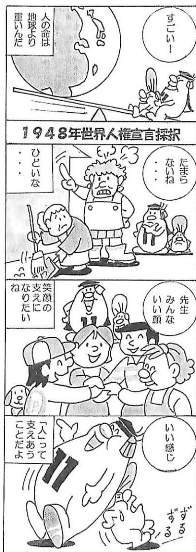
1948年世界人権宣言採択