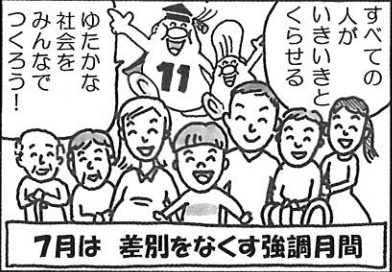
7月は 差別をなくす強調月間