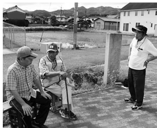
▲体操の後は楽しくコミュニケーション