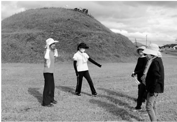
▲市尾墓山古墳に集合！

新型コロナウイルス感染症の影響で、自宅にすることが多くなり、運動不足になっていませんか？ 市尾墓山古墳では、地域の住民が集まって毎朝ラジオ体操をしています。 今月は、市尾ラジオ体操同好会を取材しました。