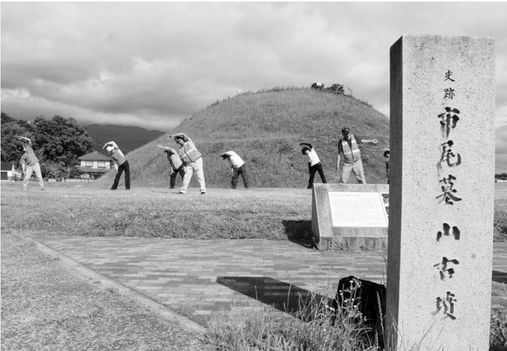
▲市尾ラジオ体操同好会の皆さん