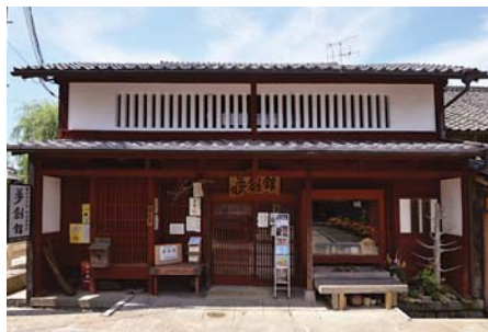
▲観光案内所 夢創館

土佐街道沿いに位置する上土佐大字は、人口149人。観光案内所「夢創館」があり、観光情報の発信と交流の拠点となっており、観光客も多く訪れます。